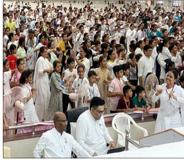
બ્રહ્માકુમારીઝના આબુ શાંતિવન ખાતે યોગા બાળ મહોત્સવનો પ્રારંભ થયો હતો.

પાલનપુર, તા. ૨૯ રાજયોગા બાળ મહોત્સવ ૨૫ બ્રહ્માકુમારીઝના આબુ સ્થિત શાંતિવન ખાતે આરંભ થયો હતો. દેશભરના ૪૦૦૦ બાળકો સનાતન સંસ્કૃતિ યોગા ઈશ્વરીયજ્ઞાન અને ભારતીય સંસ્કૃતિના રંગે રંગાયા હતા. વૈશ્વિક અધ્યાત્મ સંસ્થા બ્રહ્માકુમારી દ્વારા બાળ ચરિત્ર ઉત્થાન હેતુ સનાતન સંસ્કૃતિ યોગા ભારતીય પરંપરાના પરિચય દ્વારા બાળ માનસના સકારાત્મક પરિવર્તન માટે વિશાળ રાજયોગા બાળ મહોત્સવનો આબુ શાંતિવન