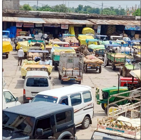
તલોદ માર્કેટ યાર્ડમાં બાજરીના ભાવ મુદ્દે ખેડૂતોએ વિરોધ પ્રદર્શન કર્યું હતું.

તલોદ, તા. ૨૯ તલોદ માર્કેટ યાર્ડમાં હરાજીમાં બાજરીનો ભાવ ઓછો મળતા ખેડૂતોએ રોડ પર વાહનો મૂક્યા. તેમણે કારોબારીઓને આગ્રહ કર્યો છે કે, પોલીસની દરમિયાનગીરીથી માર્કેટ યાર્ડના ધોવાના આક્ષેપ સાથે ખેડૂતોએ